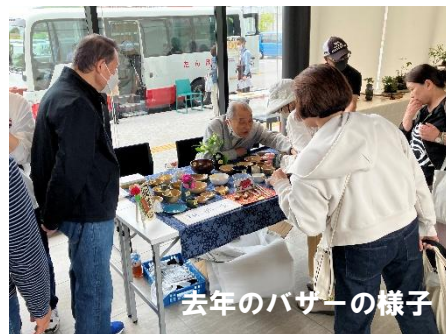
去年のバザーの様子

当館所属のクラブの方々の企画運営によるおまつりです。展示、芸能、体験、バザー、そして飲食コーナーなど盛りだくさんです。上記の時刻は変更になる場合があります。詳しくは、順次発信予定の Web/SNS/チラシをご覧ください。