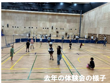
去年の体験会の様子